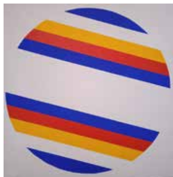
In senso orario , 2021, acrilico su tela, cm 50x50