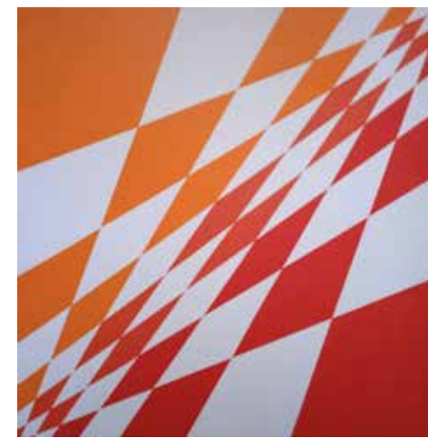
La scacchiera di Fibonacci , 2022, acrilico su tela, cm 80x80