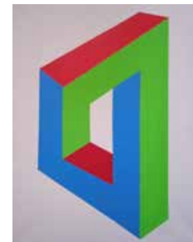
Telaio impossibile , 2020, acrilico su tela, cm 40x50