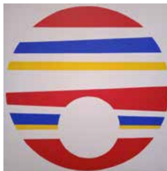
Due cerchi , 2022, acrilico su tela, cm 50x50