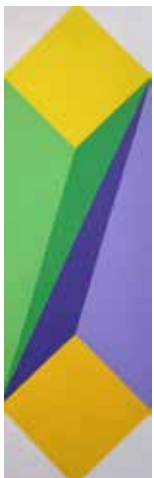
Dinamismo , acrilico su tela, cm 20x65