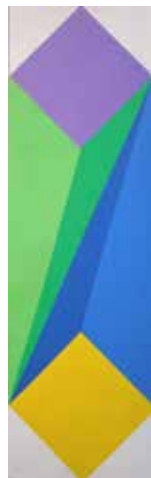
Come le primule , acrilico su tela, cm 20x65