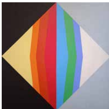
Caldo-freddo , 2016, acrilico su tela, cm 60x60