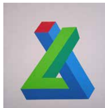
Incrocio impossibile , 2020, acrilico su tela, cm 40x40