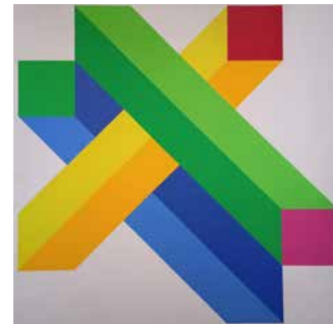
Intelaiatura impossibile , 2022, acrilico su tela, cm 80x80