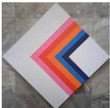
Tutto il resto è sogno , 2016, acrilico su tela, cm 60x60