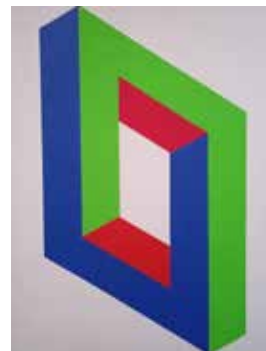
Cornice impossibile , 2020, acrilico su tela, cm 40x50