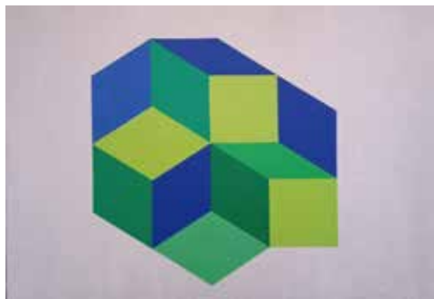
Antica Roma , 2022, tecnica mista su tela, cm 50x70